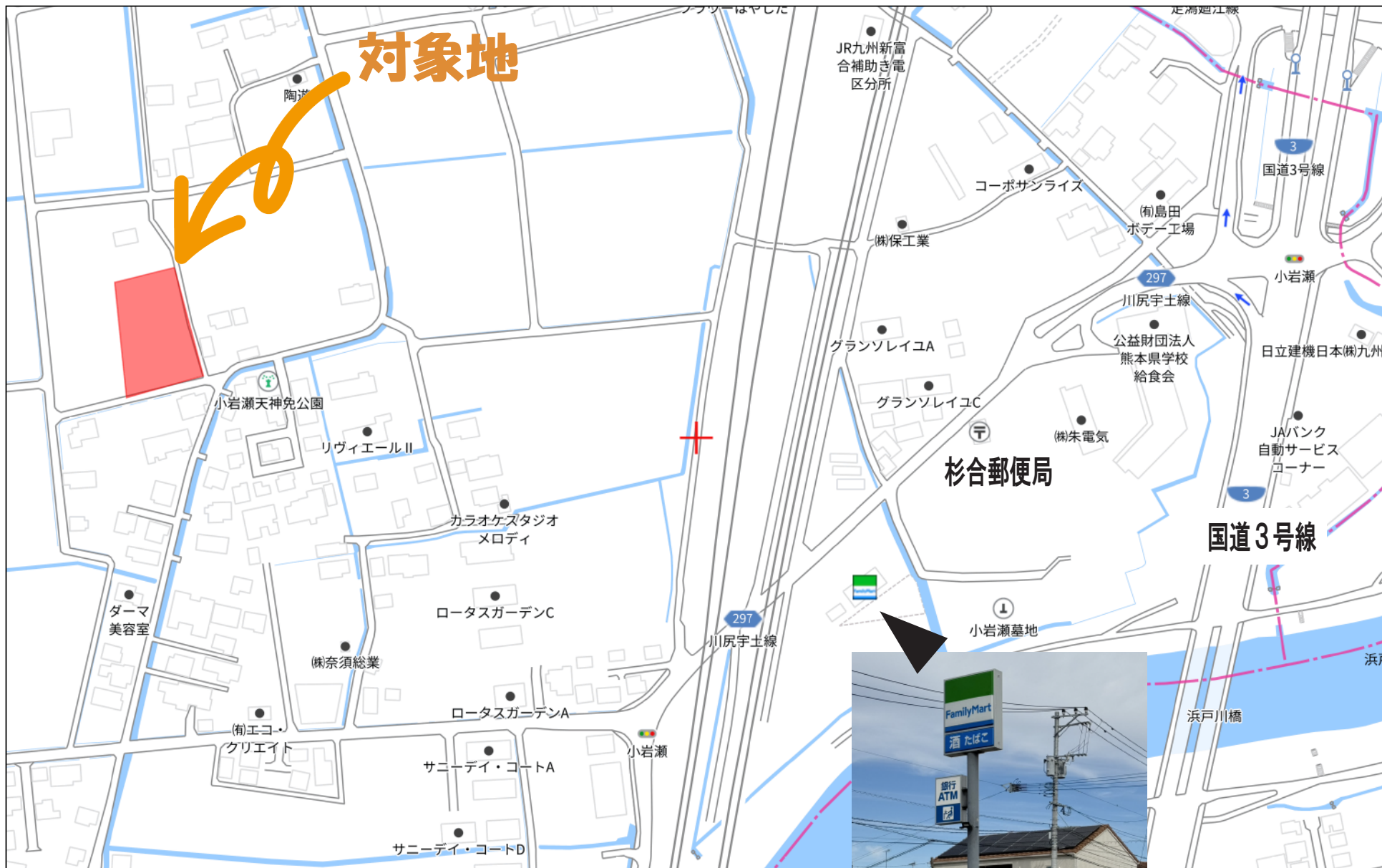
ファミリーマート 富合小岩瀬店